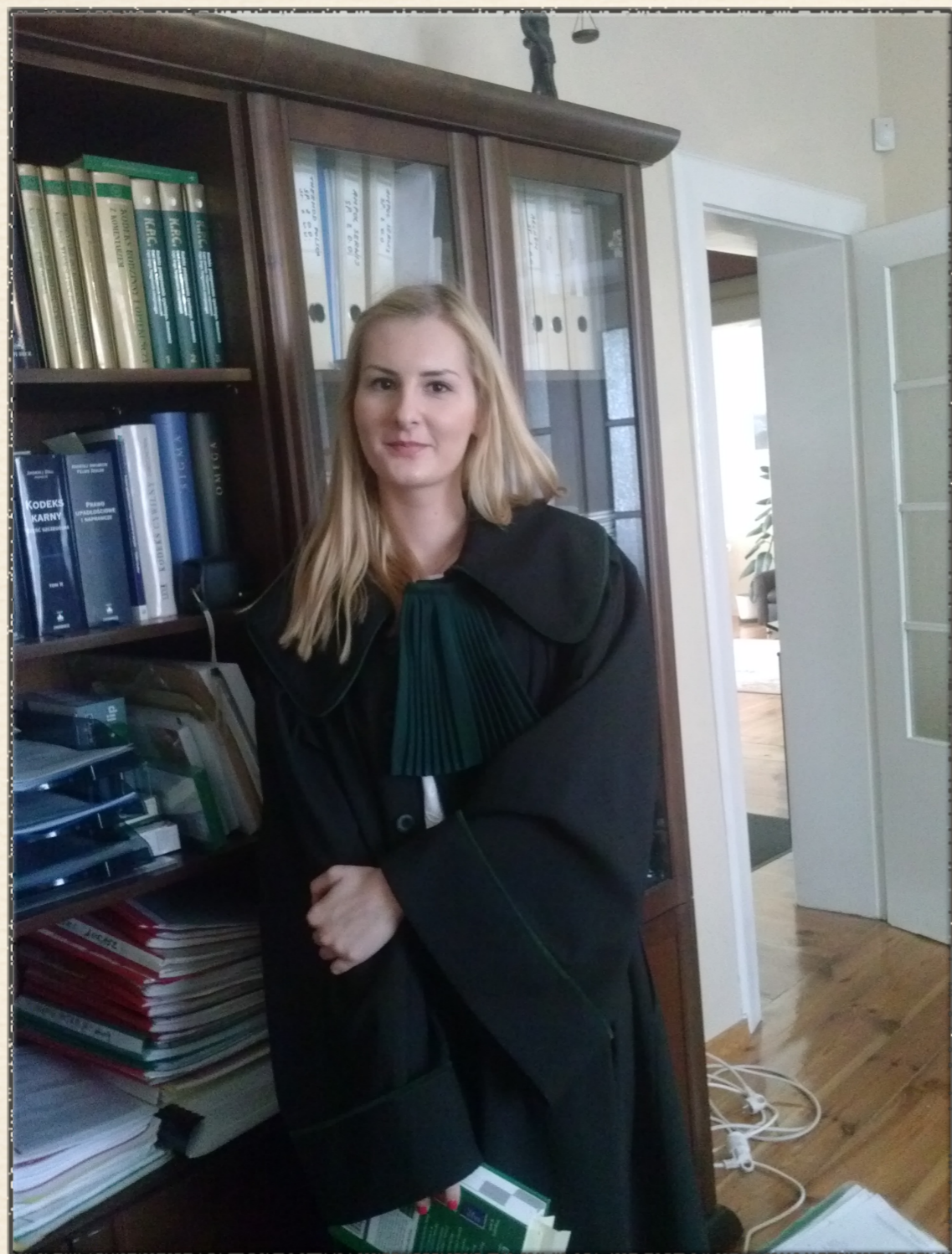
Toga - nieodłączny atrybut adwokata...