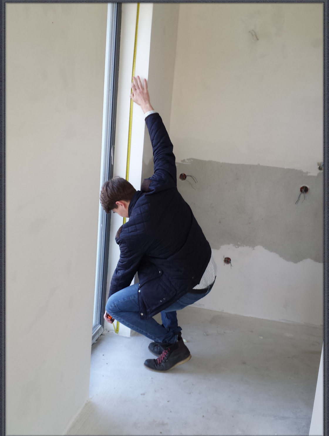
...chyba wszystko się zgadza... :-)