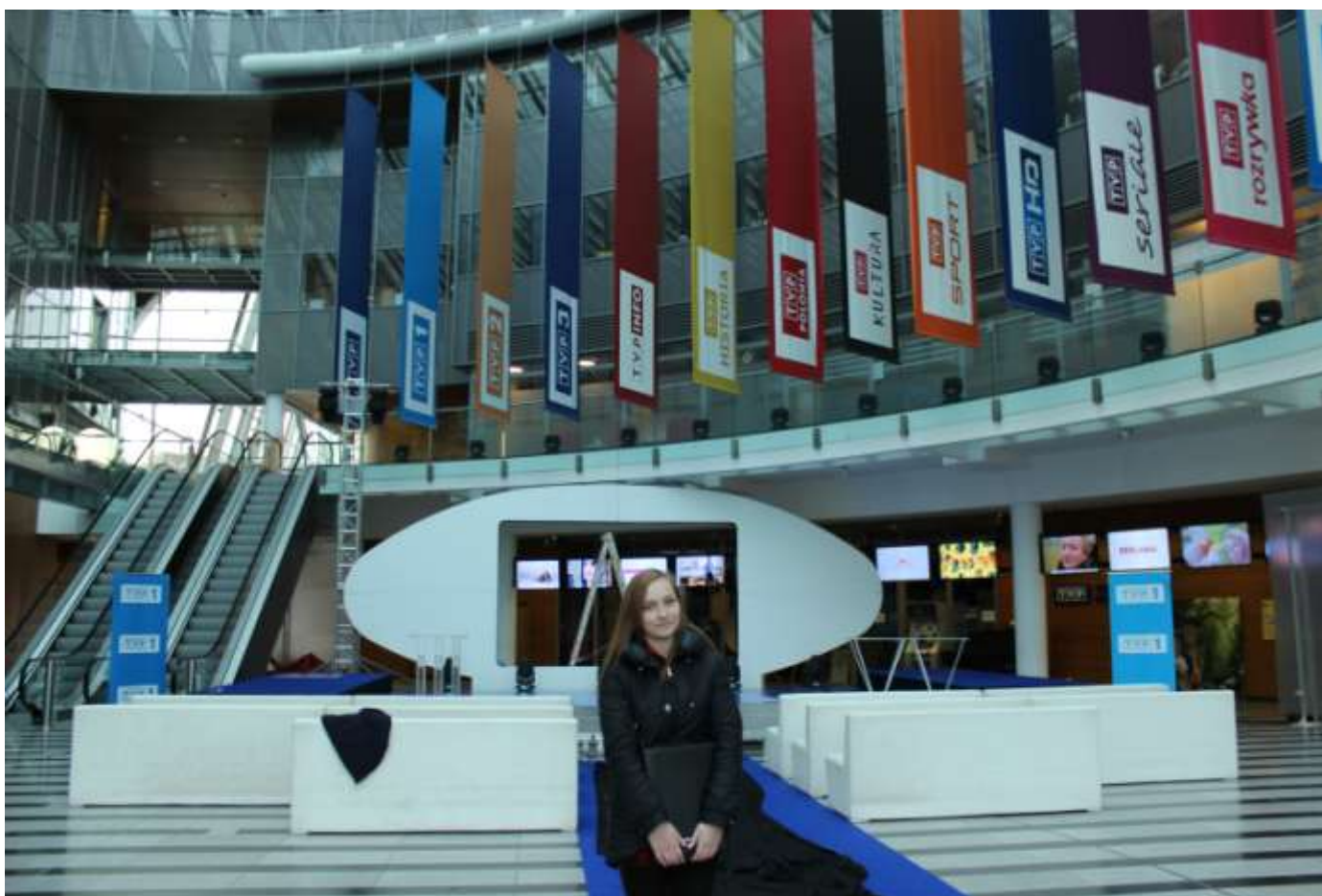
Główny hol TVP.