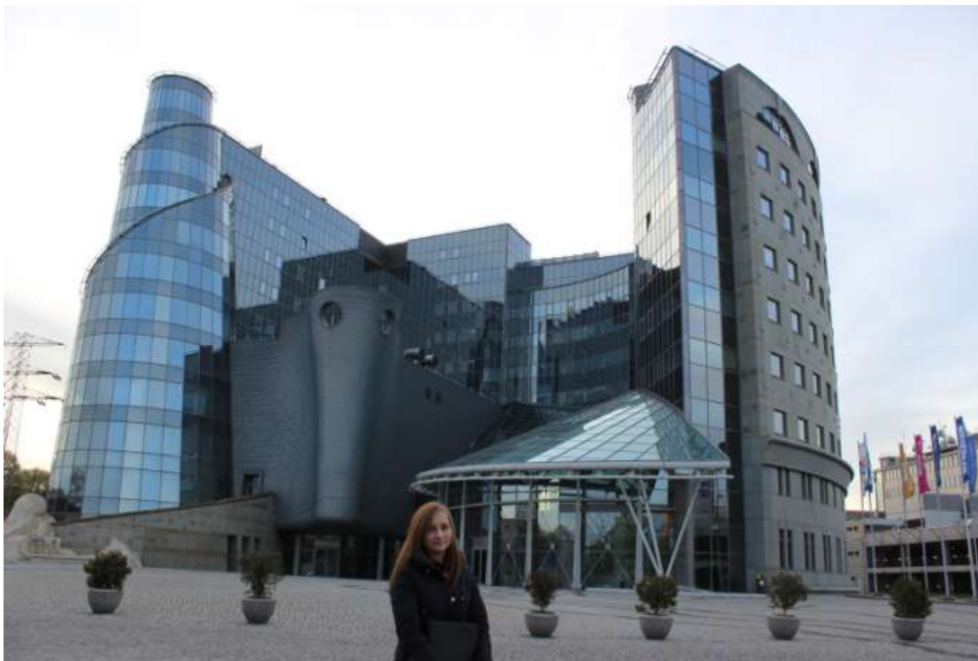
Przed budynkiem TVP, ul. Woronicza 17 w Warszawie.